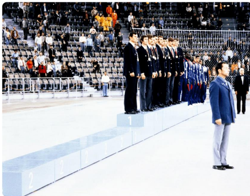
Boycott du podium, Munich 1972

Les basketteurs américains refusent de monter sur le podium après leur défaite contestée en finale contre les Soviétiques