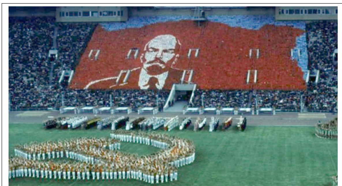
Moscou 1980, une ambiancz de guerre froide