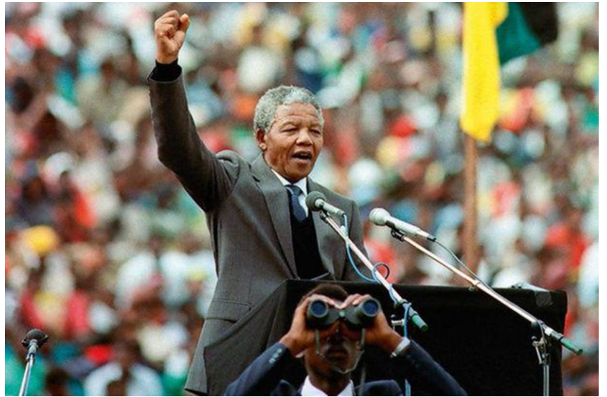
Le discours de Nelson Mandela